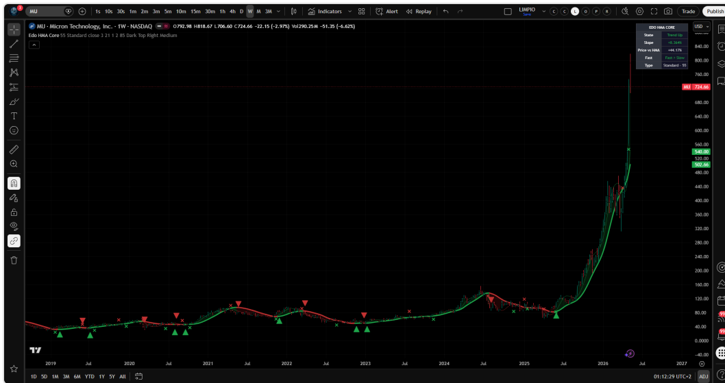
Edo HMA Core sobre MU semanal: HMA principal con color de estado, fill de tendencia, marcadores de inflexión y cruces, y panel de información.

Forma parte del ecosistema Edolab como indicador de uso libre, publicado en TradingView, y está diseñado para integrarse con cualquier sistema de momentum, estructura o volumen sin solaparse con sus lecturas.