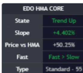
Panel Edo HMA Core mostrando State, Slope, Price vs HMA, Fast y Type.

El panel resume en cinco campos el estado actual del activo según la lectura del indicador. Aparece superpuesto en el gráfico, en la esquina configurada por el usuario, y se actualiza en cada vela.